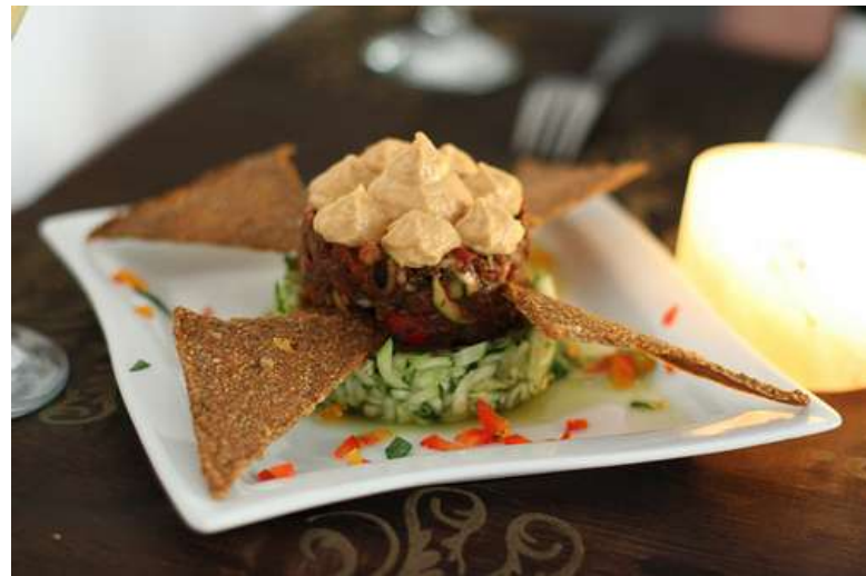
by Geoff Peters 604