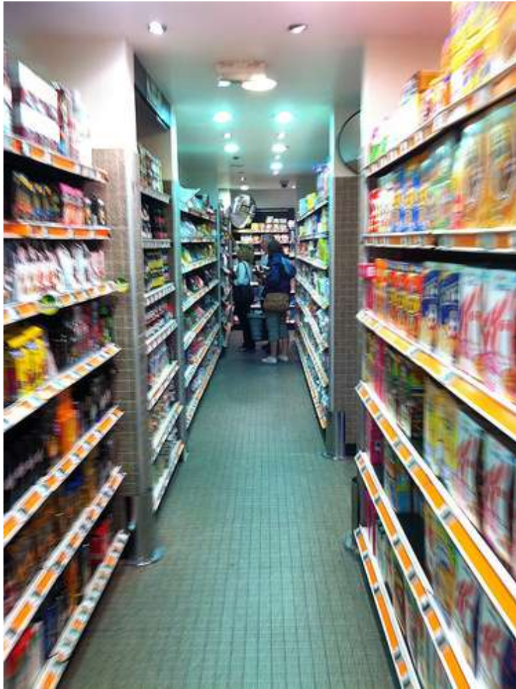
by Sean MacEntee